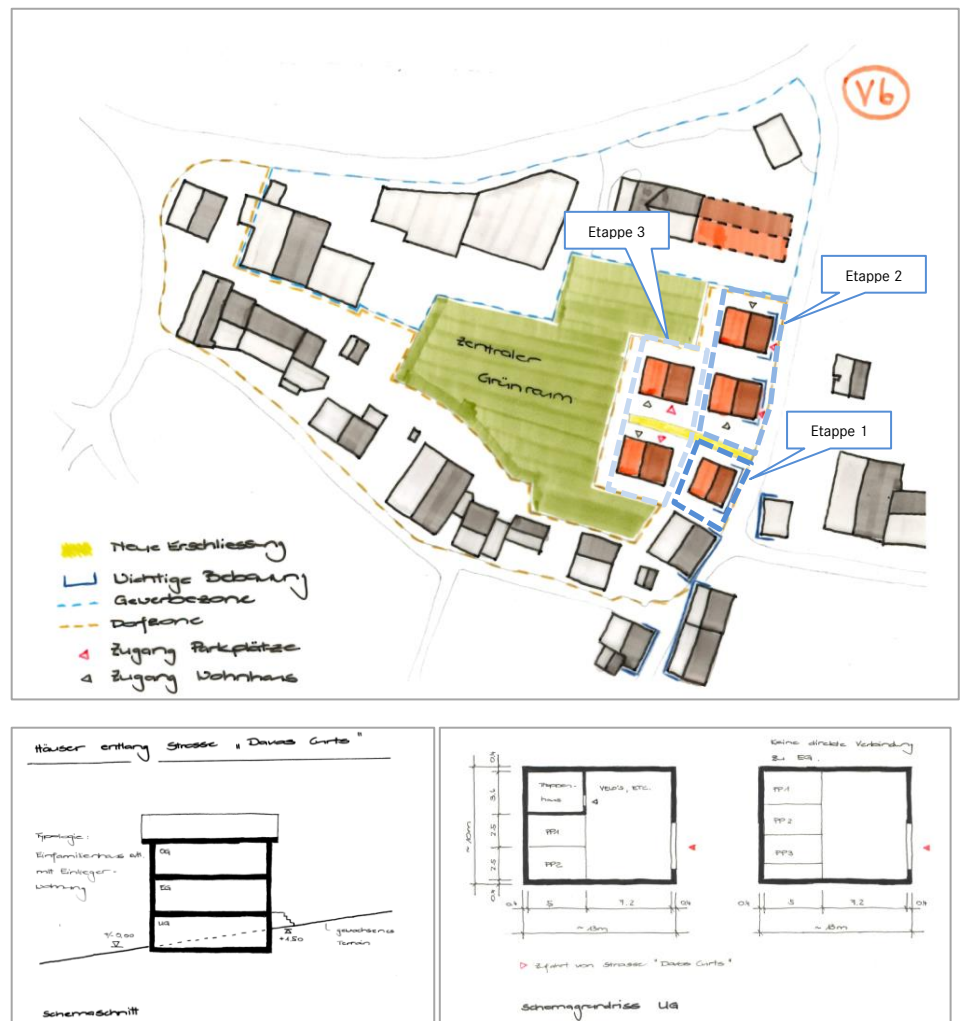
Abb. 1: Bebauungsstudie Custanzas (Variante 6) mit Schemaschnitt und Schemagrundriss.

Im Rahmen der vorliegenden Teilrevision werden die planerischen Voraussetzungen ausschliesslich für die Etappe 1 geschaffen. Die weitere Entwicklung des Gebietes wurde im Variantenstudium im Sinne einer Grundlage aufgezeigt, bildet aber explizit nicht Gegenstand der vorliegenden Teilrevision. Für die 1. Etappe bestehen bereits konkrete Bauabsichten bzw. ein Bauprojekt für eine Bebauung. Dieses präjudiziert die aufgezeigten Varianten für die Weiterentwicklung nicht.